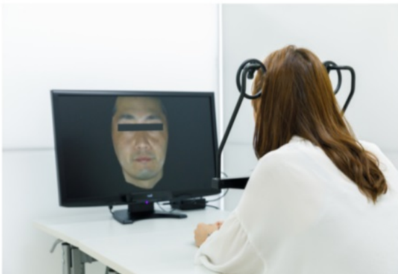
図2 顔画像の注視部位を10部位に分類