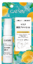
レモンミントの香り