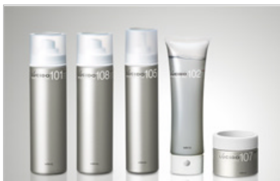
写真左から ヘアトリートメントウォーター101 150g ¥1200/スタイルキープケアスプレー108 160g ¥1200 スタイルアップヘアフォーム105 150g ¥1200/スタイルアップヘアジェル102 140g ¥900/スタイルアップヘアワックス107 90g ¥1200

パッケージも、上質感のあるシンプルなデザインで、これまでの大人の男性化粧品には見られなかったおしゃれなイメージとともに、毎日のスタイリングを楽しく演出します。