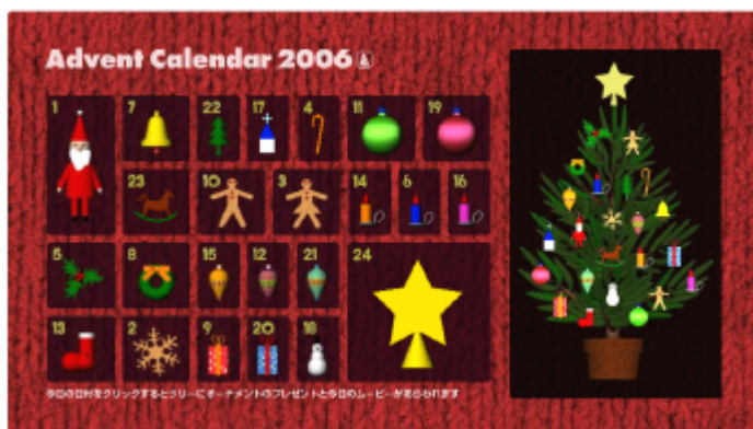
アドベントカレンダー イメージ