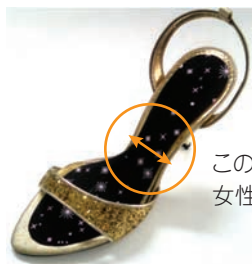
この幅が細いデザインが 女性用の靴では多い

デザイン性の高いスリムなパンプスをはじめとしたほとんどの靴に、キレイにフィットします。