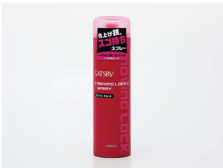
ギャツビー ムービングロックスプレー エクストラハード 170g/¥840(税抜 ¥800) 希望小売価格

マンダムは2009年2月23日(月)、ギャツビー『ムービングラバーシリーズ』から『ムービングロックスプレー エクストラハード』を新発売します。