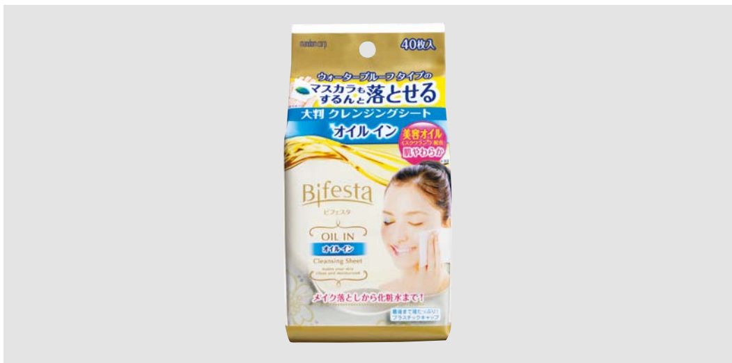
ビフェスタ クレンジングシート オイルイン