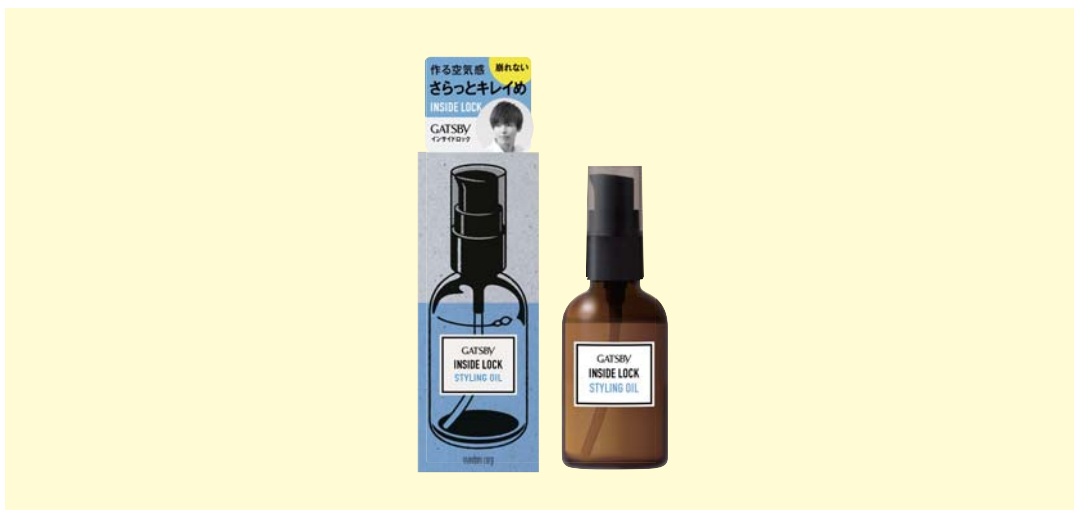
ギャツビー インサイドロック スタイリングオイル